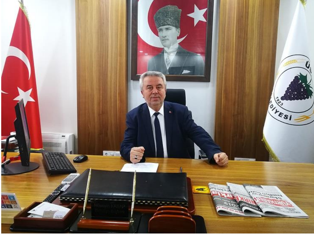
Hüseyin KASAP Üsküpl Belediye Başkanı