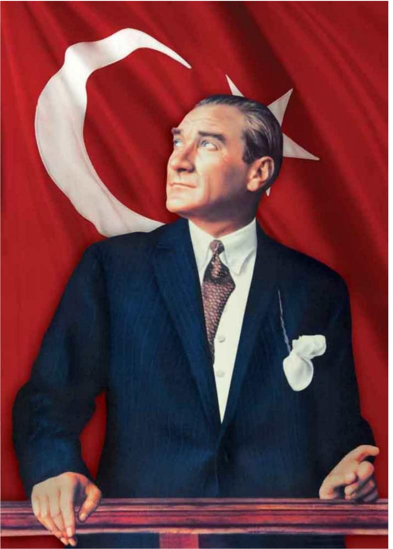
Mustafa Kemal ATATÜRK