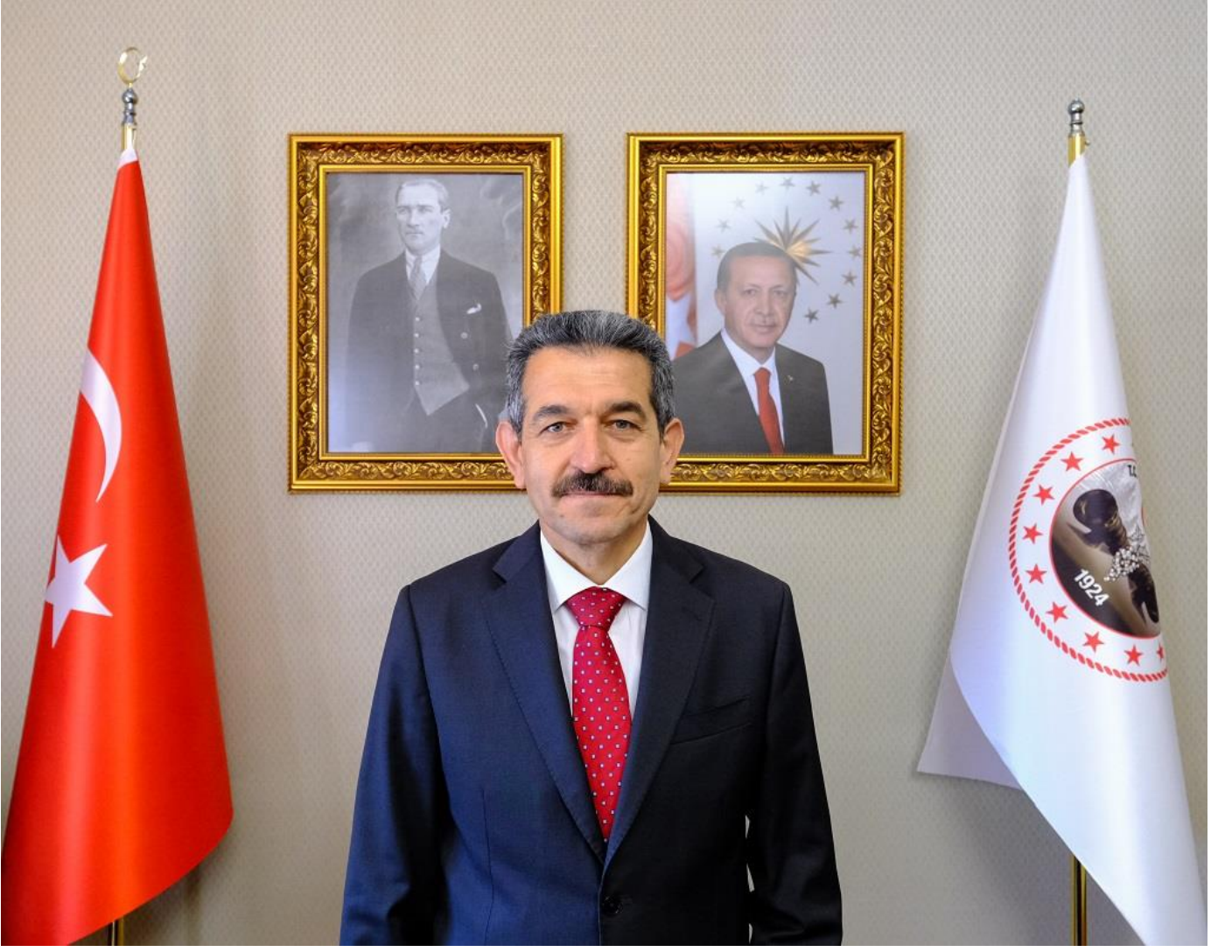
Birol EKİCİ Kırklareli Valisi