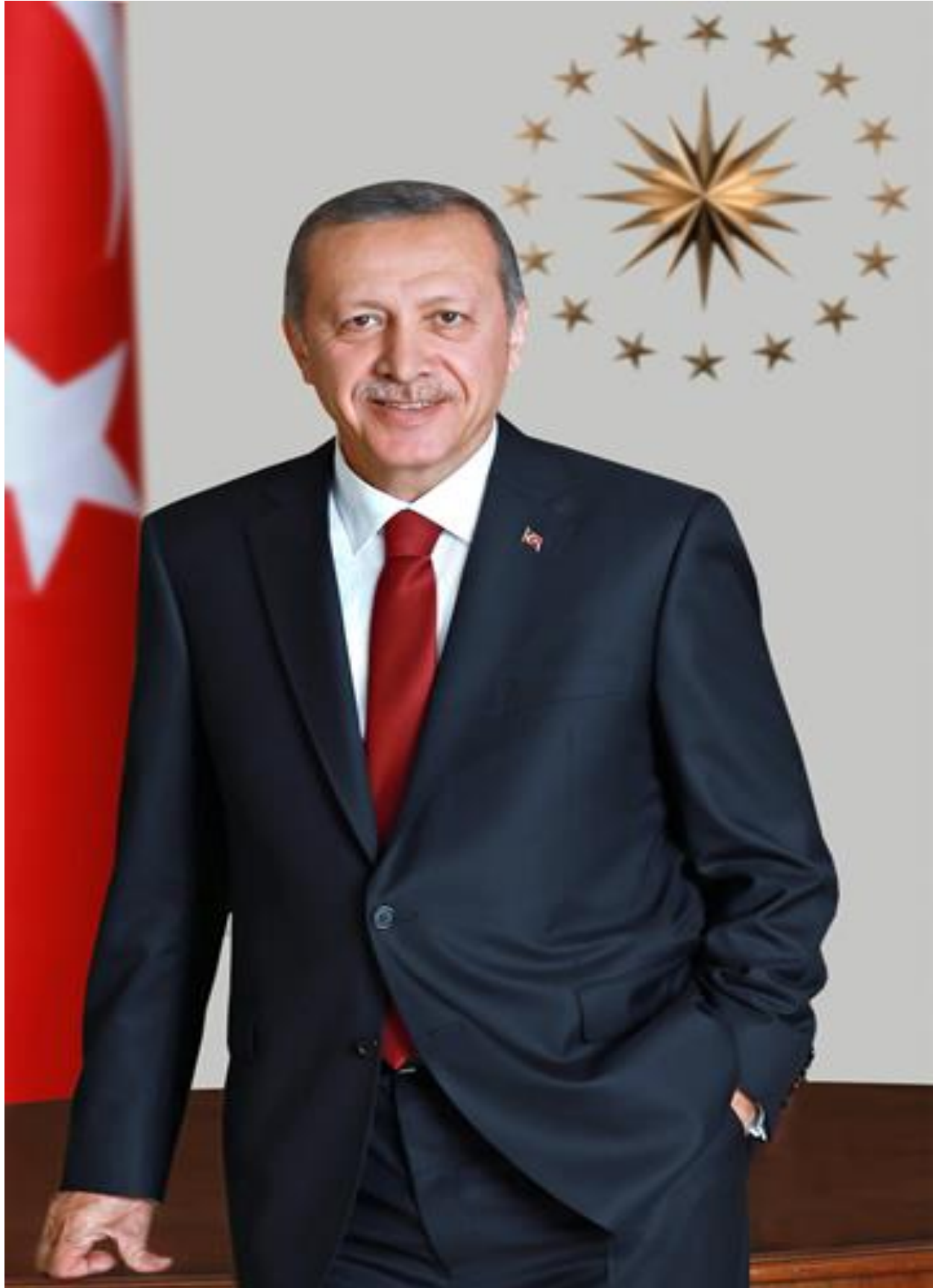
Recep Tayyip ERDOĞAN Cumhurbaşkanı